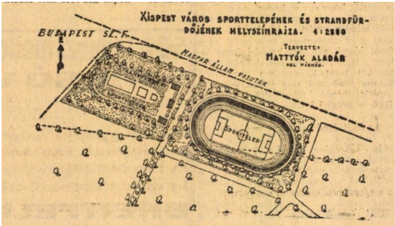
4. kép: Kispest város sporttelepének és strandfürdőjének helyszínrajza. (Ujság, 1935. július 14.)