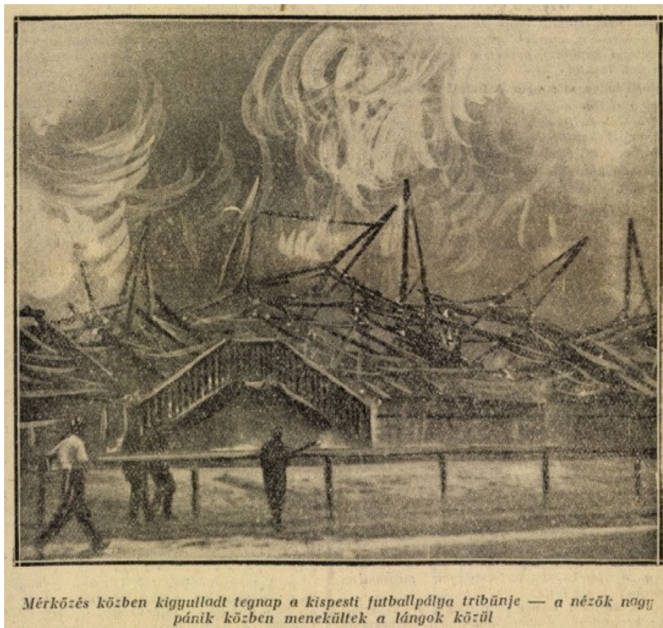
Mérkőzés közben kigyulladt tegnap a kispesti futballpálya tribünje — a nézők nagy pánik közben menekültek a lángok közül

2. kép: A Kispesti Atlétikai Club tribünjének égése. (Friss Ujság, 1934. május 8.)